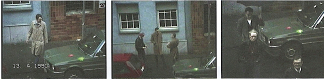
Heimo Zobernig, „Videoedition für TEXTE ZUR KUNST“, 1991, Filmstills / film stills

Isabelle Graw, "Canon and Critique: An Interplay; Heimo Zobernig," Texte Zur Kunst , December 2015, pp. 50-57.