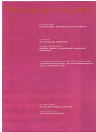
Texte zur Kunst, Nr. 11 („Feministische Theorien“), September 1993, Cover