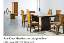
Axel Einar Hjörth's sportsfurniture.