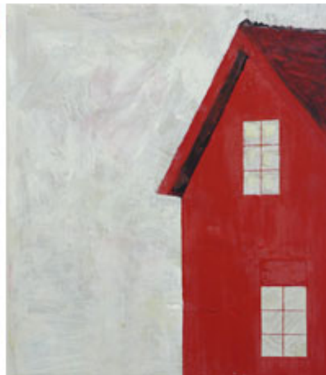
"Röd gavel" 2010, olja på pannå, 45x 39