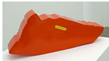
"Vargskalle" 2010, olja på trä