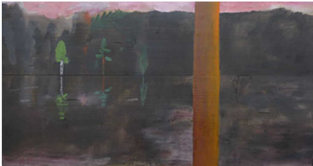
"Österviken" 2006-10, olja på pannå, 38x80 © Åke Pallarp