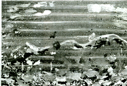
Utiliza colores luminosos que recuerdan al espacio.