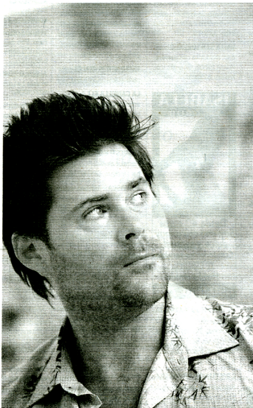
Cass vive y trabaja en la ciudad de Nueva York.

En su serie Europa del año 2003 exhibía paisajes europeos sacados de postales de viajes. ¿Las pinturas de ahora siguen el mismo procedimiento?