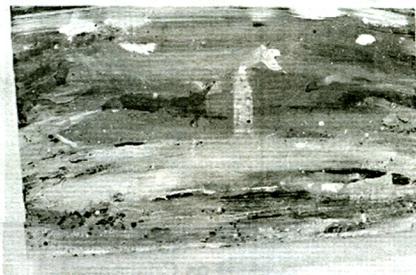
Las obras tienen un bajo relieve escultórico.