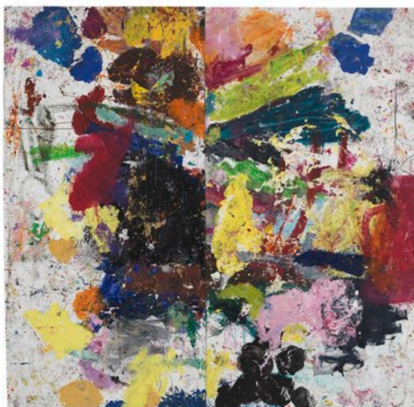
Jarl Ingvarsson, "Simsons Bröllop", 274x281 cm, 2016.

Nu är allt sådant borta. Kvar är målningar som bara är färg. Där det nästan handlar mer om det fysiska anbringandet av färgen på duken än den till synes mer eller mindre slumpmässiga form som bildas.