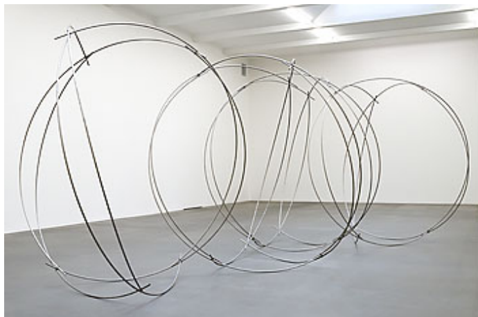
"Theorem B", 2013, titan, höjd 180 cm © Lars Englund