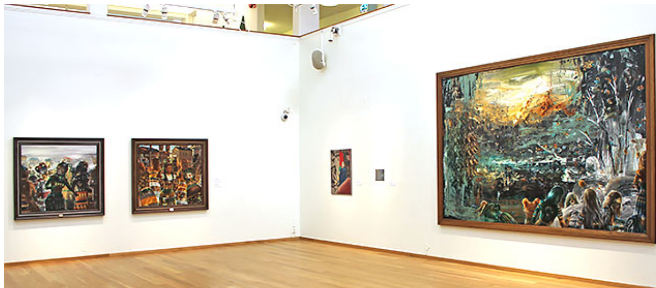
Utställningsvy. "Ion" © Billgren/von Kröckert

Det är två decennier som möts på Borås Konstmuseum. Det optimistiska 80-talet med sin "satsa på dig själv"-ideologi och svulstiga estetik möter ett kylslaget 2010-tal med bortblåst framtidstro. Billgren-von Kröckert visar måleri och skulptur från i huvudsak dessa två decennier och ingenting däremellan. Det ställer tidsandan från de två olika decennierna i blyxtbelysning. Det är trettio år sedan Billgren-von Kröckert började måla sina rävar, änder och storögda rådjur.