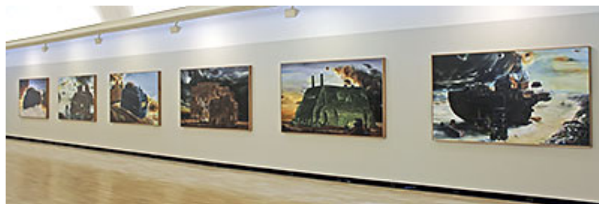
"Vår tanks" m.fl © Billgren/von Kröckert

Starkast av de senare verken blir raden av sex målningar på andra våningen. Utgångspunkten är Vår tanks , en äldre målning med två män/pojkar framför en gammal, lite grovt gestaltad militärtanks. Billgren-von Kröckert har här gjort en ny serie målningar och utgått från den yttre formen av en tanks. Landskapen är öde och hotfulla. Den mörka centrala formen kan lika gärna föreställa en tanks som en Noas ark, Förgöraren och Räddaren i samma skepnad.