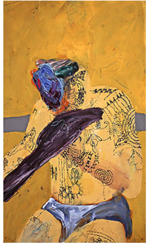
"Boxare attackerad av kobra" © Ernst Billgren

Borås 2016-10-19