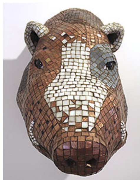
"Konstsvin I", 1990 © Ernst Billgren