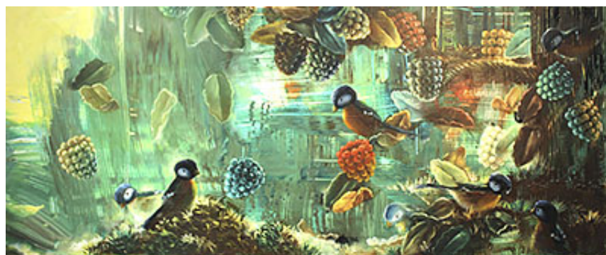
"Fåglar och bär" © Billgren/von Kröckert

Det finns en underliggande provokativ vilja hos Billgren-von Kröckert. Han tycks ständigt fråga sig vad som är ok i konstvärlden och vad som inte är det. På 80-talet var frågan delvis materialbaserad; mosaik, batik eller målad skulptur var inte ok – då fick det bli så. Idag finns superrealistiska animerade bildvärldar i dataspel utanför och bortanför konstvärlden. Billgren-von Kröckert verkar ha hämtat mycket av sin inspiration från dessa kitschiga världar.