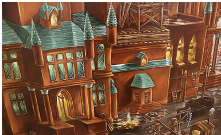
"Bygget och gruvan" (detalj), 2015 © Billgren/von Kröckert

Även djuren befinner sig numera i en hotad och onaturlig omgivning. Den humoristiska And landar på gädda av misstag från 1990 har blivit till Leda med vänner från 2012, med svanar simmande i ett träsk och träd med handgranatliknande frukter. Målningen Nära framtid från 2016 skildrar en närmast apokalyptisk framtida undergång och Vår Planet associerar till ett sjunket samhälle, ett nytt Atlantis. Både fiskar och människor möts under vattenytan.