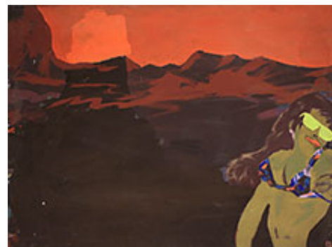
"Försvunnet berg" © Ernst Bilgren

Det är två decennier som möts på Borås Konstmuseum. Det optimistiska 80-talet med sin "satsa på dig själv"-ideologi och svulstiga estetik möter ett kylslaget 2010-tal med bortblåst framtidstro. Billgren-von Kröckert visar måleri och skulptur från i huvudsak dessa två decennier och ingenting däremellan. Det ställer tidsandan från de två olika decennierna i blyxtbelysning. Det är trettio år sedan Billgren-von Kröckert började måla sina rävar, änder och storögda rådjur.