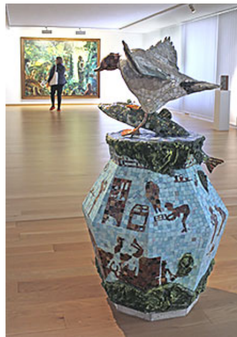
"And landar på gädda av misstag", 1990

Idag är tiden en annan än då Ernst Billgren gick på Valands Konsthögskola. Från en ung sökande konstnär har han förvandlat sig själv till ett konstnärligt varumärke. Många av de sena målningarna är briljanta i både teknik och komposition. Ändå saknas något. Kanske glädjen över nya upptäckter, kanske tron på mänskligheten och planetens överlevnad. Sådant man kan finna i de tidiga målningarna. Numera är det kyligt och dystopiskt i den billgren-von kröckertska bildvärlden. Ernst Billgren vs Wilhelm von Kröckert är dock på många sätt en imponerande utställning, som ger tillfällen till funderingar om