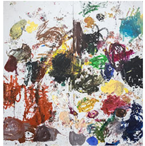
"Diamant-Tiger På Helspänn", 268x252 cm © Jarl Ingvarsson