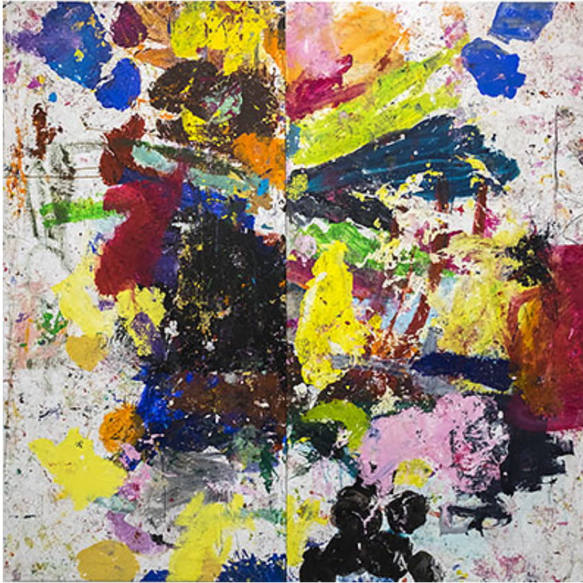
"Simpsons Bröllop", 274x279 cm © Jarl Ingvarsson

fläckarna att bilda rent figurativa element, eller endast en gäckande inbillning. Allmän, privat eller personlig.