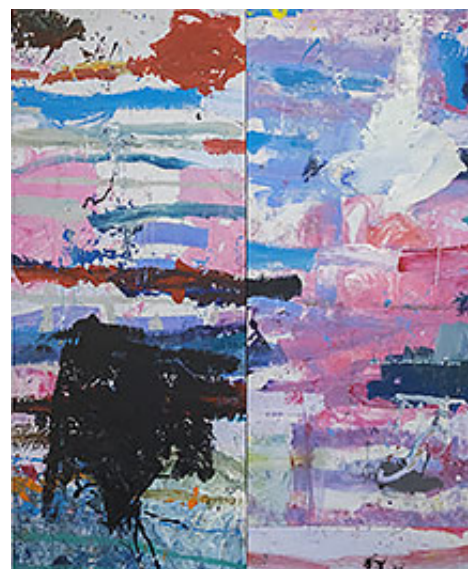
"Dubbel Vresros", 300x246 cm © Jarl Ingvarsson

Men Jarl Ingvarsson vore inte den strålande målare och bildmakare han är utan att sprida fler nycklar som var och en söker sitt lås. Titlarna kan ur erfarenheten eller ett surfklick bort studsas åter med ett innehåll som bjuder