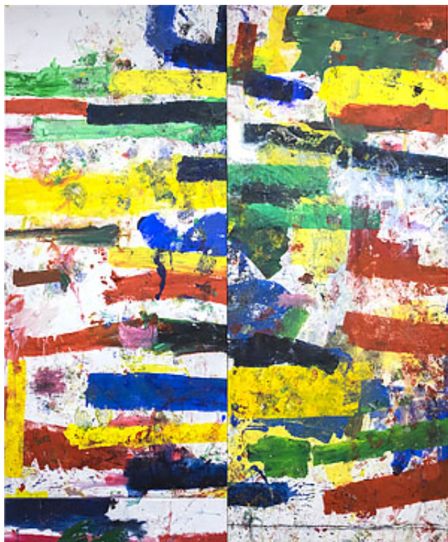
"Asylstäderna", 300x246 cm © Jarl Ingvarsson