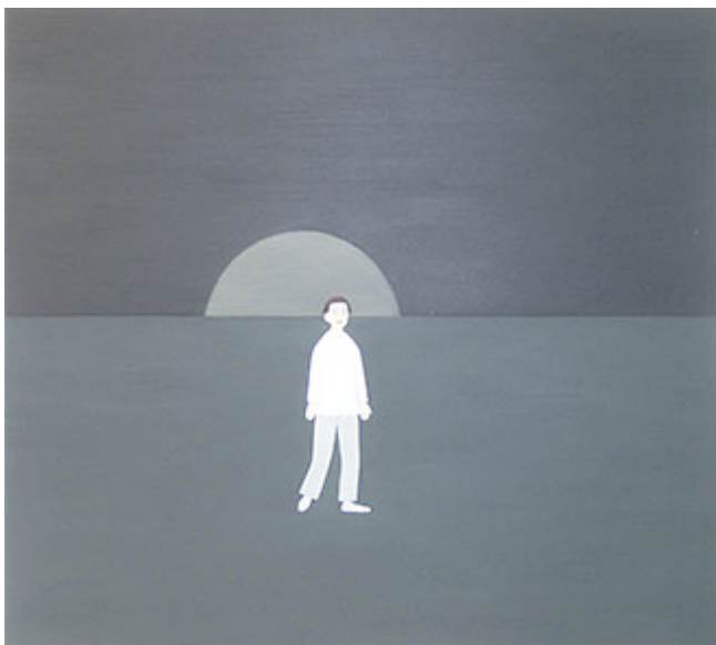
"Solnedgång" Rita Lundqvist