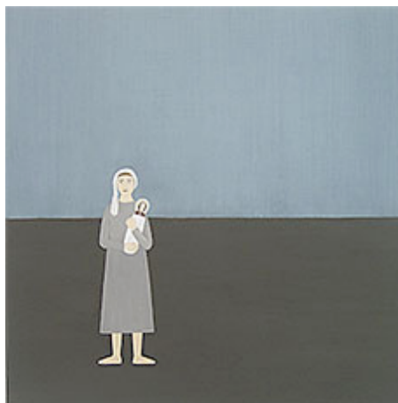
"Helgon" © Rita Lundqvist