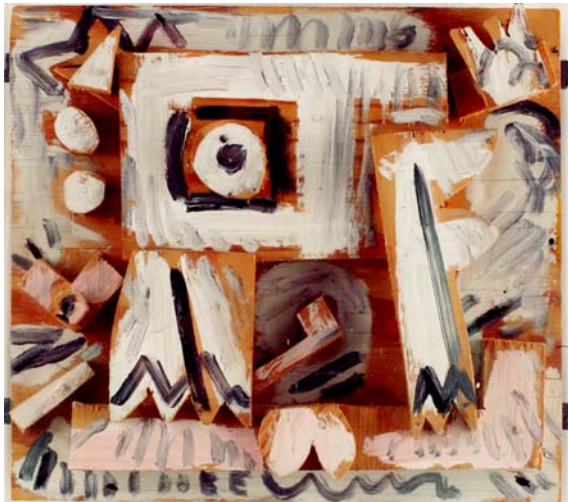
Kommunalt odjur, 1965

Vilket språk använder Elis i sina texter? Vad är det för skillnad mellan talspråk och skriftspråk? Vad är det för skillnad mellan en dialekt och slang? Hur talar vi med varandra, talar man på samma sätt med sina kompisar som med en lärare, en okänd vuxen eller sin mamma?