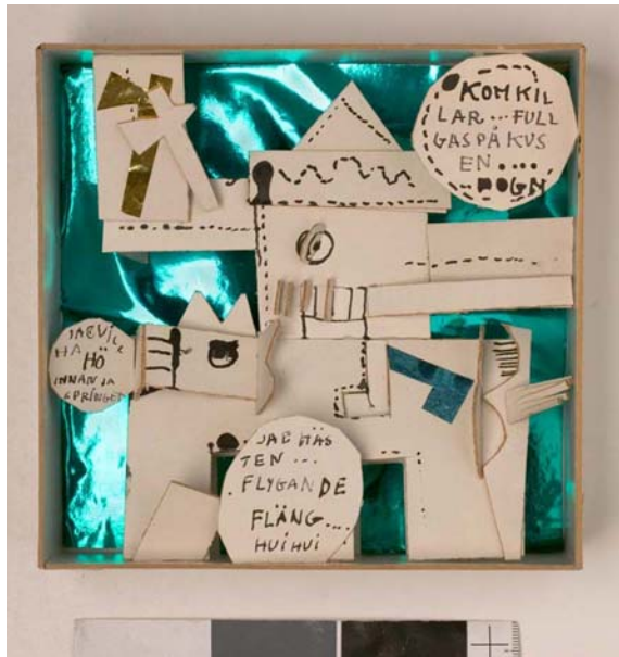
Pavan till häst 1965

I början av 60-talet blir leken allt mer central i eee:s konst. Han började göra vad han själv kallade vikåklipptjofjeser, en form av ritade bilder som skulle klippas ut, vikas och klistras ihop till collage. I utställningen "Indijaner å en kåvbåj" på Galerie Burén 1965, en av de allra första svenska galleriinstallationerna, introducerade han figuren Pavan och hans vänner Ägget, Krokodilet mfl. Enligt eee var det inte han som hittade på dem, utan de som kom till honom. De skulle sedan återkomma i hans bildvärld under många år. Hela galleriet var tapetserat med en berättelse i collage, bilder och texter. Den handlade om striden mellan "indijaner och en kåvbåj" och jakten på krokodilets öga. När utställningen var slut revs och kastades den och idag finns det därför bara ett fåtal objekt kvar.