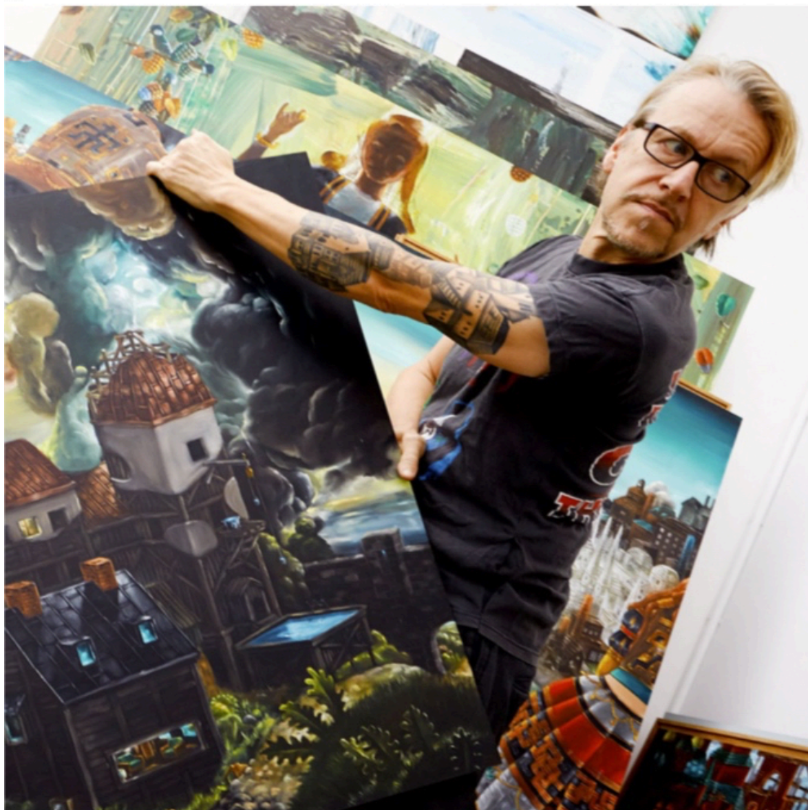
finns också någonstans i dem och mönstren i målningarna kommer från kretsformernas former, säger Wilhelm von Kröckert.

Hanna Fahl hanna.fahl@dn.se Sverker Lenas sverker.lenas@dn.se