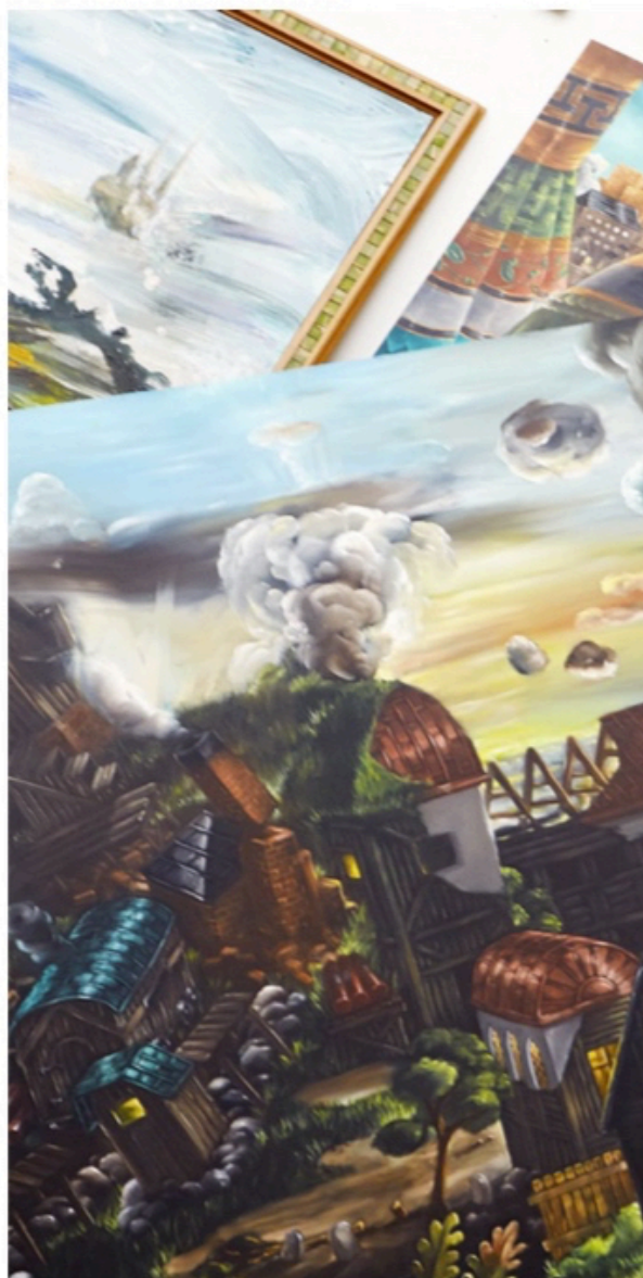
– Jag ser målningarna som resultatet av hela konsthistorien på något sätt. Tv-spel

– De är vad som redan finns i mitt huvud. Jag ser målningarna som resultatet av hela konsthistorien