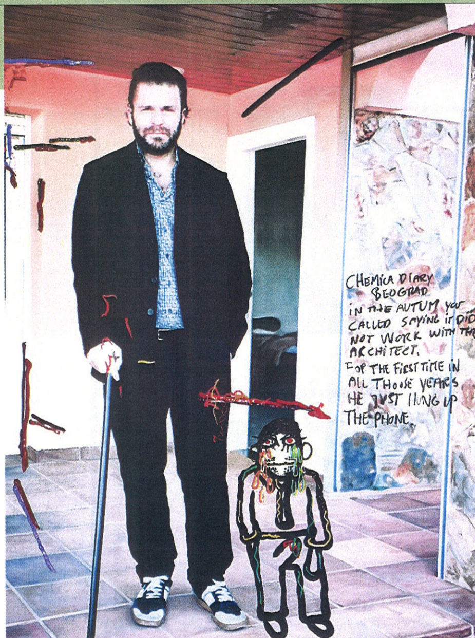
Kontroversiell: Kunståret åpner med Bjarne Melgaard på Astrup Fearnley-Museet i Oslo den 21. januar. Vil fjorårets etikdebatt om Melgaards pedofilbilder blusse opp igjen? BJARNE MELGAARD «UNTITLED» 2009

Hvis den New York-farende morgenbladleser kommer seg av sted før mars måned, bør hun sette av en dag i et tilsynelatende tomt Guggenheim-museum. Tino Sehgal er sjeldent nok ikke utdannet kunstner, men har studert dans og økonomi. Utstillingen viser immaterielle «verk», som består av gester, tale, sang og bevegelse i gallerirommet. Sehgal kaller dem «situasjoner», og lar sine skuespillere fremføre dem i mer eller mindre frivillig samhandling med publikum.