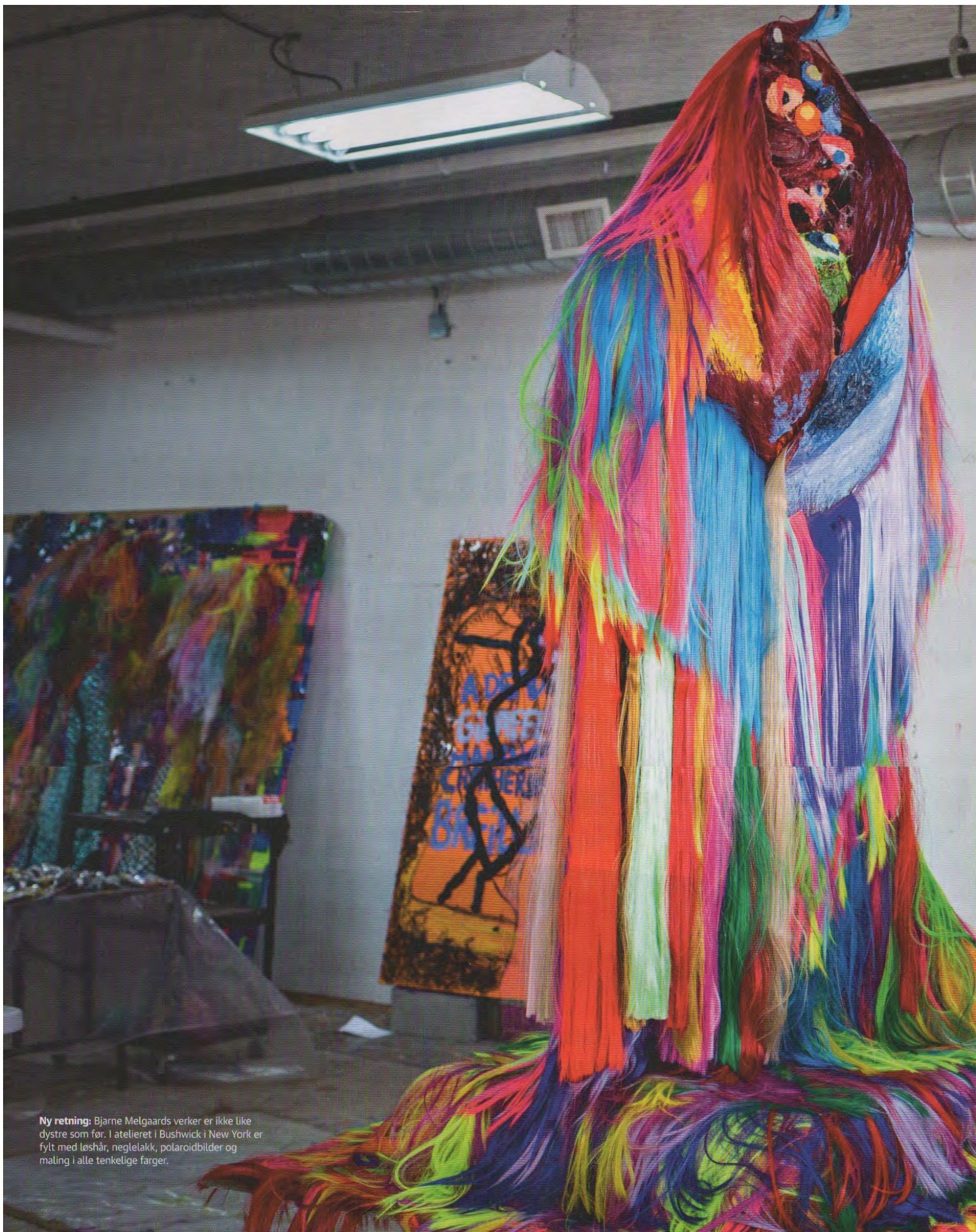
Ny retning: Bjarne Melgaards verker er ikke like dystre som før. I atelieret i Bushwick i New York er fylt med løshår, neglelakk, polaroidbilder og maling i alle tenkelige farger.