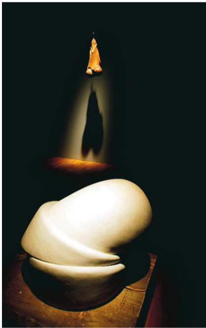
Fr v: Sleep II (1967) visades vid utställningen på Kulturhuset 2002. Moderna museet äger träskulpturen Pillar från 1949. Femme (2008) fanns med på utställningen hos Andersson Sandström 2009.