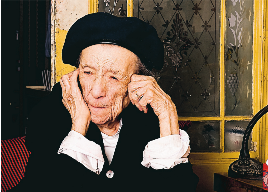
Louise Bourgeois fotograferad 2008.