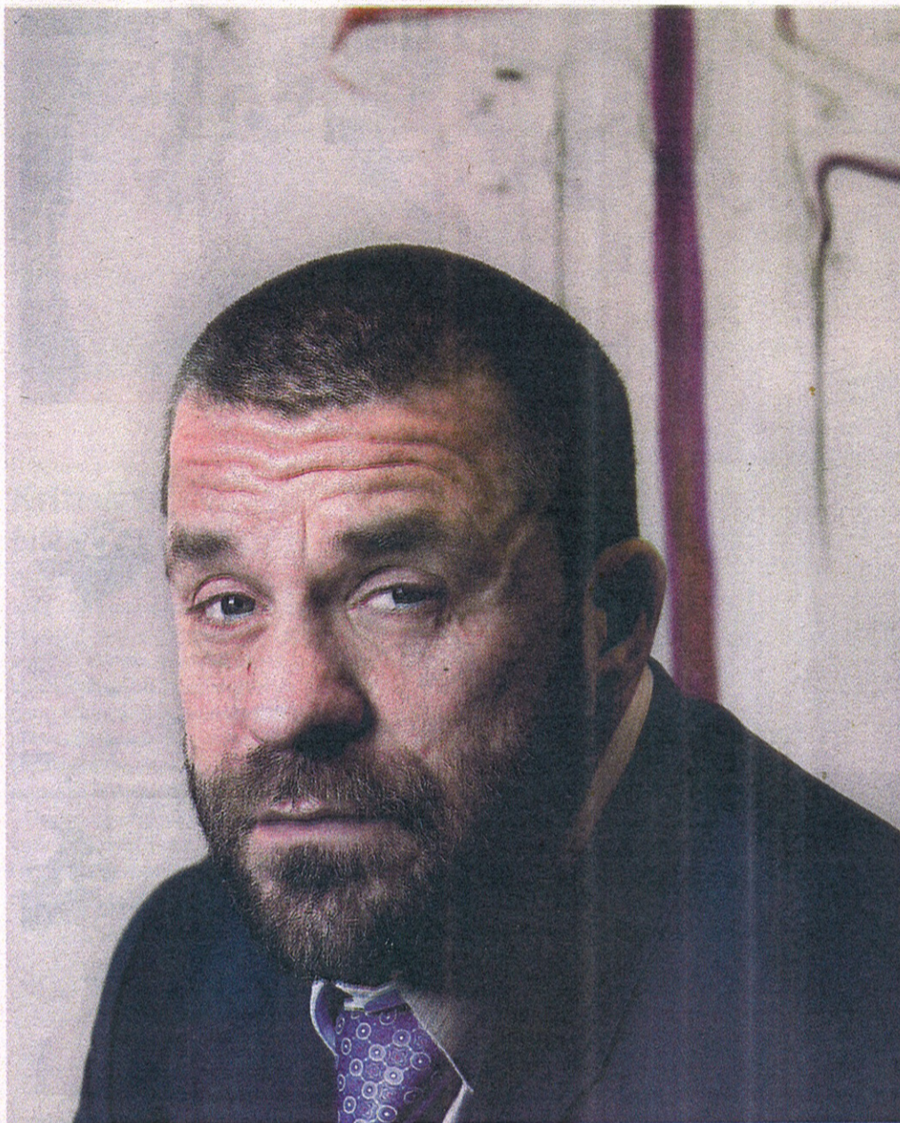
Bjarne Melgaards billedverden vises i en stor retrospektiv utstilling i Astrup Fearnley Museet. I bakgrunnen skimtes litt av et av utstillingens store oljemalerier.