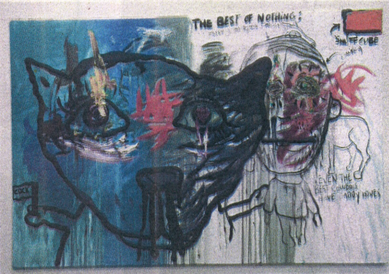
Det beste av ingenting. Slik lyder budskapet i dette bildet, som også er uten tittel.