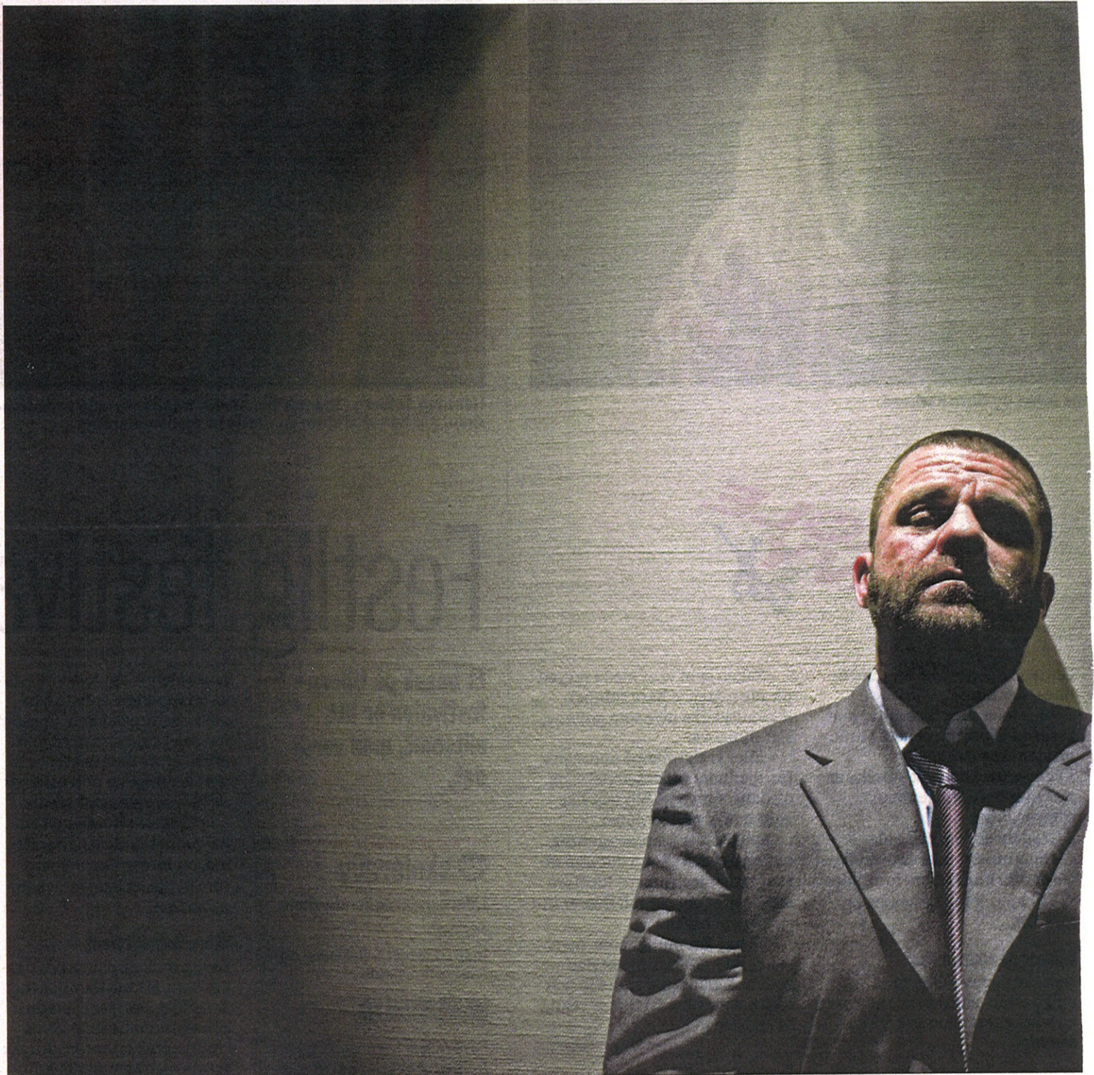
Jeg kommer til å se ut som en leiemorder, sier Bjarne Melgaard da fotografen plasserer ham inntil veggen på Astrup Fearnley-museet. I kveld åpner Melgaards retrospektive utstilling «Jealous» på Astrup Fearnley og i morgen kveld skal han snakke om film på Cinemateket.

– Det er jo også et slags kunstnerportrett, Erika har lyktes i kunsten og fått anerkjennelsen, men så sklir det helt ut i hennes personlige liv.