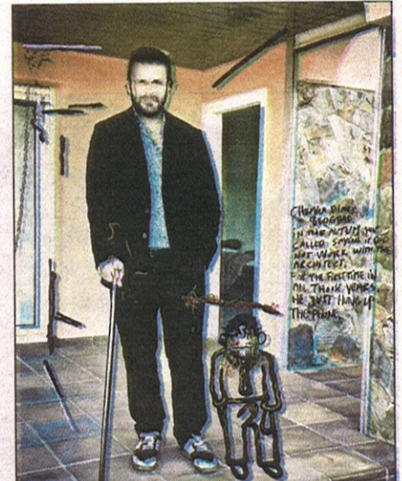
I Untitled fra i fjor har han inkludert et bilde av seg selv.