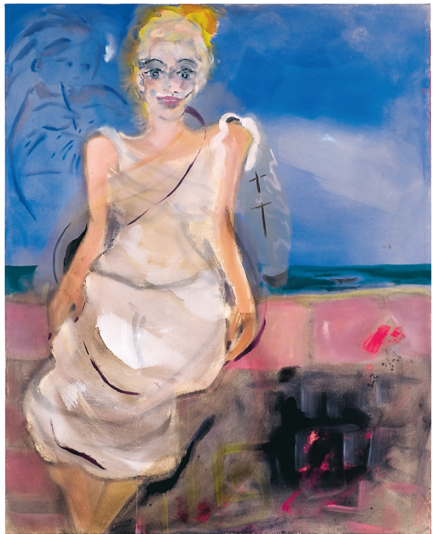
Sophie von Hellerman, Writing about a lady between Zenith and Nadin, 2010. Akryl på duk, 165 x 132 cm.