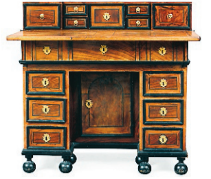
Skrivbord 1693. Beställt till kronprins Karl (XII).