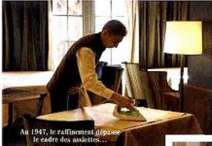
Au 1947, le raffinement dépasse le cadre des assiettes...