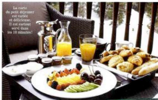
La carte du petit déjeuner est variée et délicate. Il est surtout servi dans les 10 minutes!