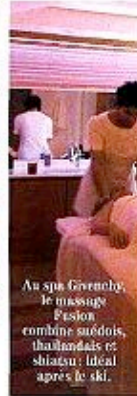
Au spa Grenobly, le massage Fusion combine suédois, thaïlandais et shiatsu : idéal après le ski.