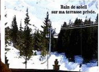
Bain de soleil sur ma terrasse privée.

Je déjeune et commence léger avec un plateau de fruits de mer bretons qui ont gravi les 1 850 mètres de dénivelé sur quelques centaines de kilomètres le matin même. Je me lâche un peu sur les desserts, le chef