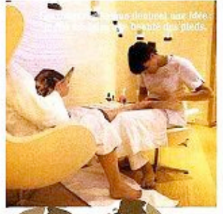
Le confort est une priorité, une idée de bien-être qui passe par le lit.