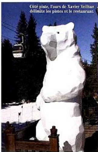
Côté piste, Fours de Xavier Veilhan délimite les pistes et le restaurant.