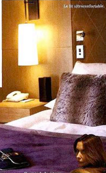
Le lit ultraconfortable.