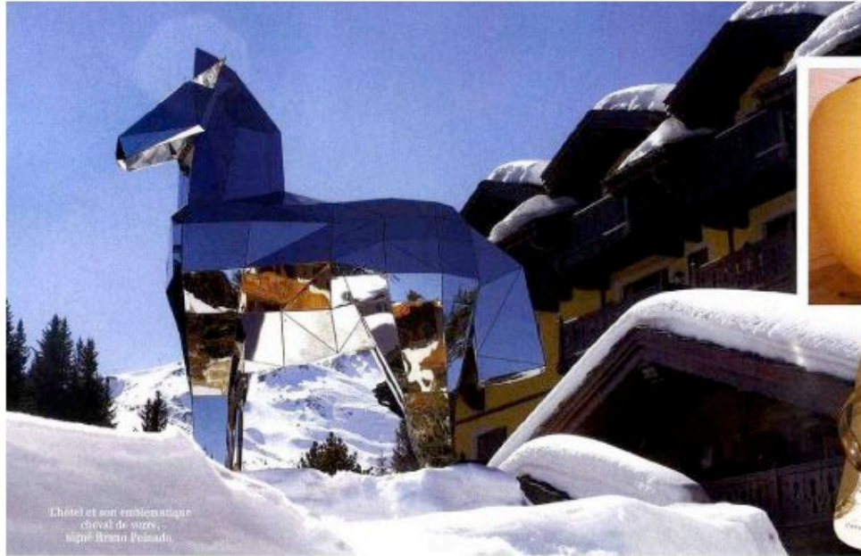
Château et son emblématique cheval de verre, signé Bruno Falaschi.