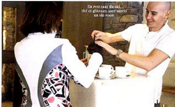
En rentrant du ski, thé et gâteau sont servis au ski room.