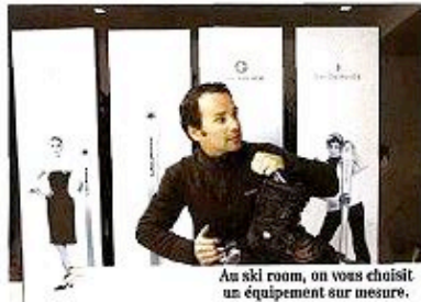
Au ski room, on vous choisit un équipement sur mesure.