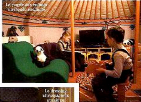
Les jouets des enfants un monde enchanté.