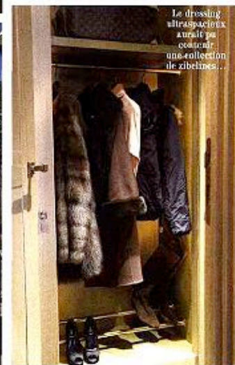
Le dressing ultraspatieux aurait pu contenir une collection de zibelines...