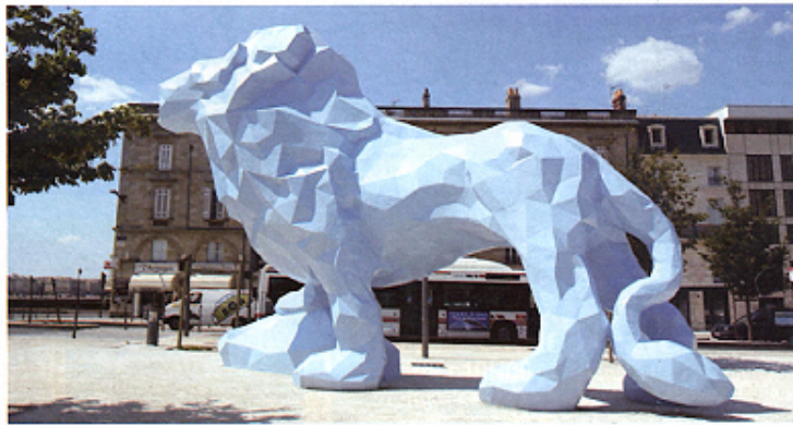
Le sculpteur Xavier Veilhan (ci-dessus), né à Lyon en 1963, a réalisé un lion monumental pour une place publique de Bordeaux et un rhinocéros pour le Centre d'art contemporain Georges-Pompidou de Paris

En ce début de l'année 2009, Le Tout Lyon poursuit la publication d'articles délibérément souriants sur la présence symbolique des animaux à Lyon, entamée l'été dernier avec un reportage sur la « Rue du Toro », dans le quartier Renaissance. Des chevaux, des crocodiles, des ours, des pingouins, des chiens, des lapins, des chats, un mammoth, des silures, des coqs, des oies et des bombyx entrèrent bientôt dans cette ménagerie de l'imaginaire, moderne Arche de Noé, réunis en un petit ouvrage à paraître sous peu aux éditions EMCC. En attendant, à tout seigneur, tout honneur, place au Roi Lion !