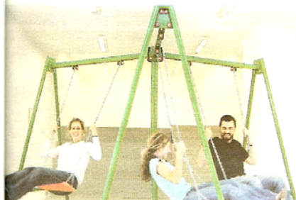
¿ME EMPUJAS? A LA IZQUIERDA, LA INSTALACIÓN «UN INGLÉS, UN FRANCÉS Y UN ESPAÑOL», DE RAFEL G. BIANCHI. ARRIBA, UNO DE LOS LIENZOS DE GRASSI