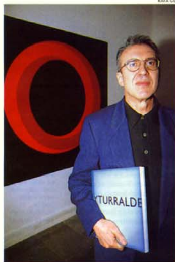
Dalt, José María Yturralde en la inauguració de l'exposició. A sota, 'Preludi', 1991. En aquesta peça Yturralde busca la dissolució de la forma geomètrica.