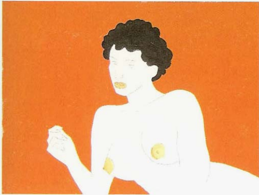
Ernesto Tatafiore: Sueños, 2006. Técnica mixta sobre papel, 58 x 76 cm.