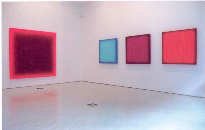
Vista general.

Escribe el filósofo Eugenio Trías que la música piensa, que la mejor música expone siempre pensamiento. No que haya que pensar la música, sino que es esta la que piensa. Del mismo modo podríamos decir con Klee y Palazuelo que la línea piensa y el dibujo es expresión del pensamiento y, siguiendo el mismo hilo argumental, que la pintura piensa y que la de los mejores –Rothko, Malevich, Mondrian, cita Yturralde– es pensamiento expuesto. En el caso de este último para: "asumir, desde la pintura, conceptos y saberes, en especial relacionados con lo infinito y la nada, lo absoluto, lo sublime y lo bello para acceder, apasionadamente, a una cierta comprensión de esos aspectos de la realidad que nos circunda".