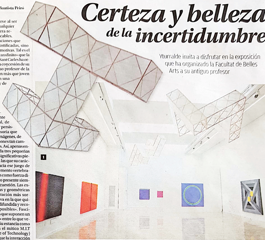
► UN RECORRIDO POR LA TRAYECTORIA DE UNO DE LOS REFERENTES DEL ARTE ABSTRACTO ESPAÑOL, y un merecido homenaje universitario. 1 Estructura volante, 197, en una panorámica de la sala Josep Renau de la Facultat de Belles Arts. 2 Deneb, 2012, Deneb, 2009. 3 Figura imposible (Serie Cuadrados) 1972 y 1971.

Yturralde invita a disfrutar en la exposición que ha organizado la Facultat de Belles Arts a su antiguo profesor