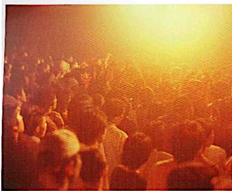
Doug Aitken: red red sun, 2006. Cortesía de la galería Helga de Alvear.