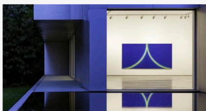
José María Yturralde