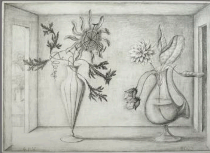
Visitación (2009). Grafito sobre tabla estacada, Guillermo Pérez Villalta.

Guillermo Pérez Villalta. El orden de lo imaginario (una suerte de retrospectiva) . Del 6 de mayo al 7 de septiembre.