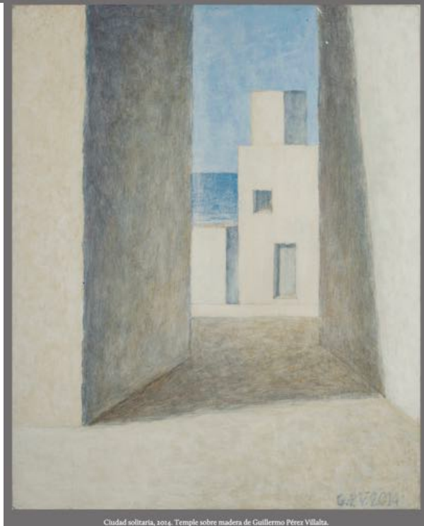
Ciudad solitaria, 2014. Temple sobre madera de Guillermo Pérez Villalta.

"Para mí el arte ha tenido siempre la intensidad que la religión para un creyente. Y ha dado sentido a mi vida. Porque, sobre todo, me aportó la base para el conocimiento. De igual forma que un científico se dedica a investigar la materia, a mí el arte me sirvió para aprender del mundo. Y no dejo de aprender. El día que eso ocurra será porque se ha acabado todo", declaró hace algún tiempo Guillermo Pérez Villalta en ABC .