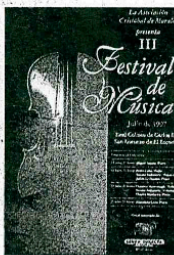
Música en El Escorial.

III Festival de El Escorial Lo acoge el Real Coliseo de Carlos III: cuatro conciertos con Brahms como invitado principal, además de piezas de Beethoven, Bartok, Scarlatti o Schubert. Días 15, 16, 22 y 25 de julio. Real Coliseo de Carlos III. San Lorenzo de El Escorial. A las 21.00. (890 17 87).