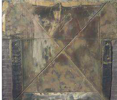
'Gran ics gratada sobre gris' (1965). Forma parte del Fondo Cultural Villar Mir, con sede en Madrid.