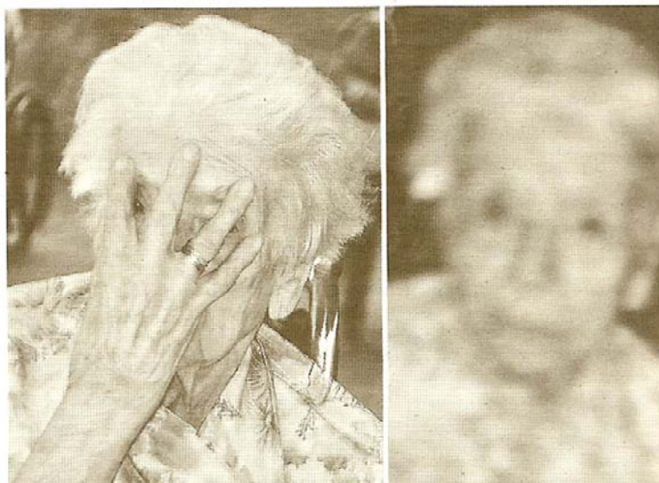
Imágenes de la serie No me olvides , de Luis Pérez-Mínguez.

res con Alzheimer con las que en los años noventa durante una larga estancia en un hospital psiquiátrico, acreditando una mirada que no disimula cuando el artista toca fondo, aplica el peso de la melancolía y acosada tentación de poner fin a sus días safari del dolor de artistas como Salgado o de su instrumentación