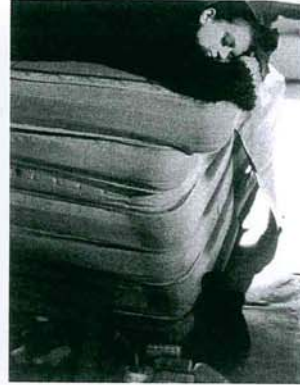
Jordi Colomer: Le Dortoir, 2002. Video.