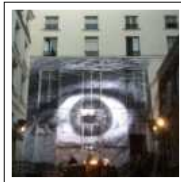
JR VS MASSIVE ATTACK