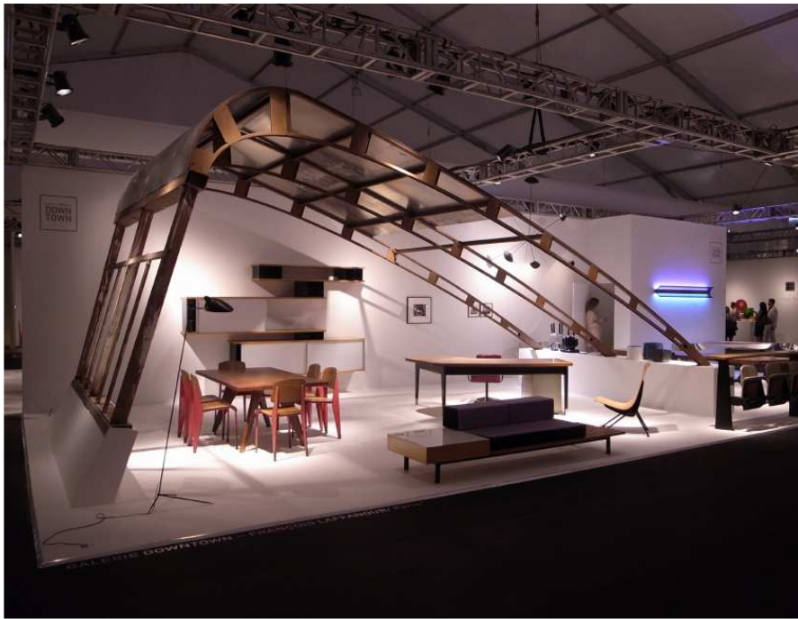
La Galerie Down town (Paris) avec une structure monumentale de Jean Prouvé