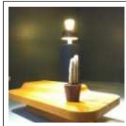
RELIEF(S) DU DESIGN