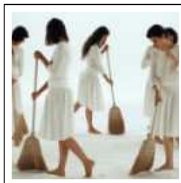
LA RONDE DES PRIX