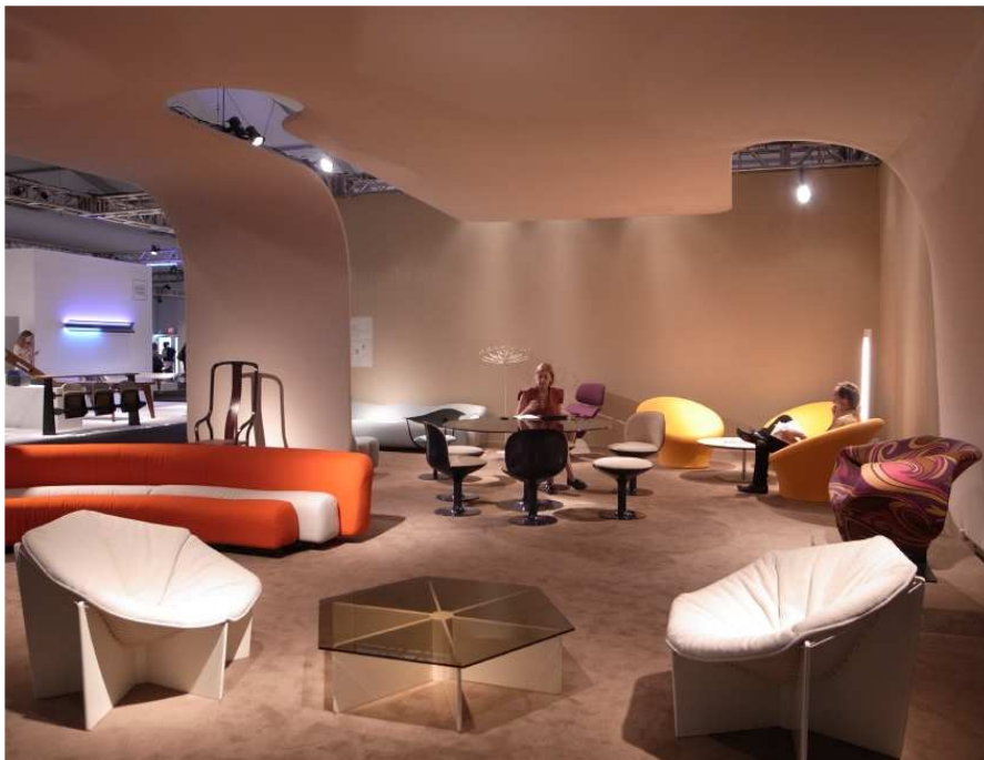
A mon avis, le stand le plus remarquable de la foire car très audacieux : la galerie Demish Danant (New York) a dédié l'intégralité de son espace à des pièces de Pierre Paulin. Un « déballage » rarement vu sur une foire où les galeries optent plutôt pour le panachage.