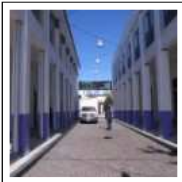
MIAMI DESIGN DISTRICT