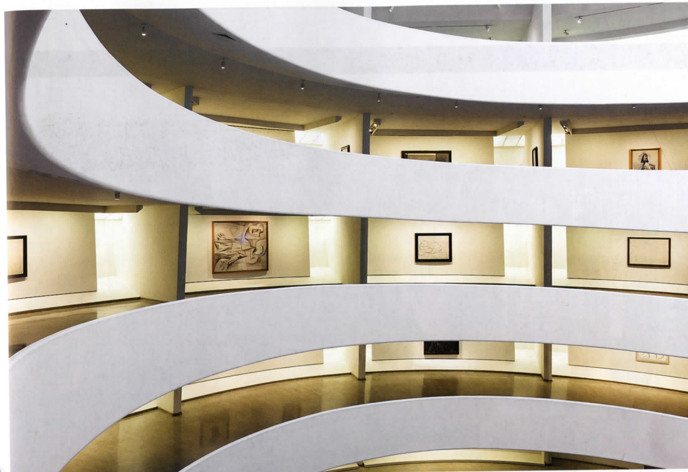
1.“黑白毕加索”展览现场，纽约古根海姆美术馆。©2012 Solomon R. Guggenheim Foundation, 摄影/David Heald 2.毕加索《米利纳的工作室》，布面油画，172×256 cm，1926年，巴黎蓬皮杜艺术中心收藏，艺术家捐赠，1947年，©2012 Estate of Pablo Picasso/ARS, New York, 摄影/CNAC/MNAM/Dist. Réunion des Musées Nationaux/Art Resource, NY

如今，芬利与第二任妻子和女儿居住在曼哈顿的LOFT公寓，周末则回到长岛的大宅中。