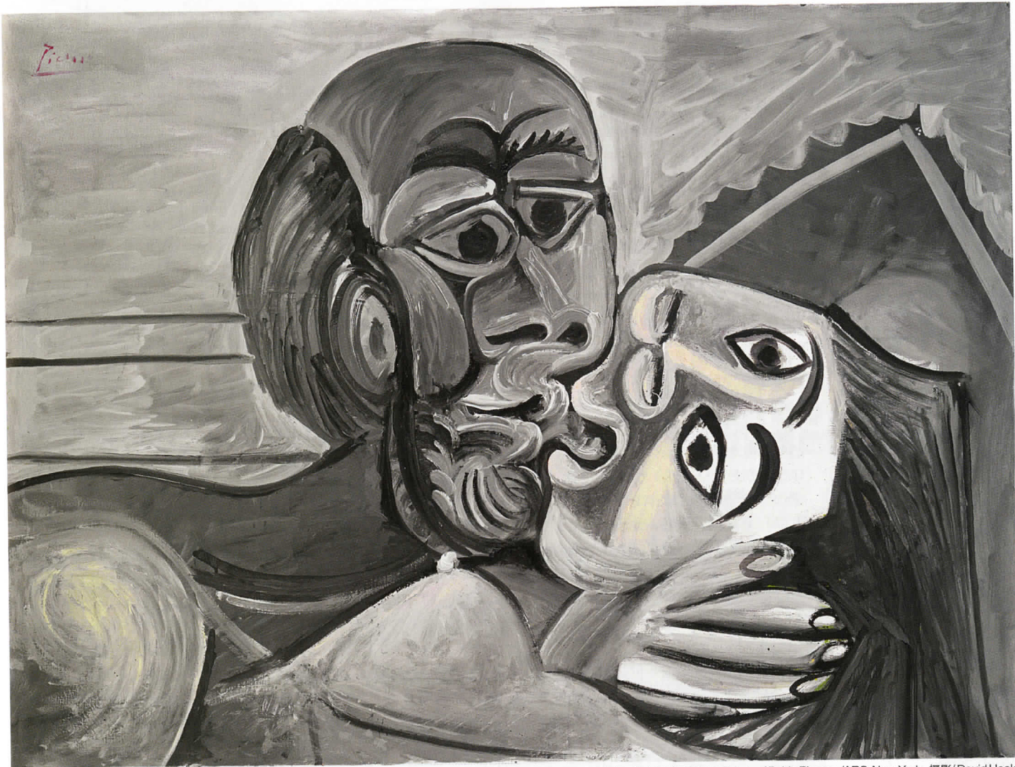
毕加索《吻》，布面油画，97.2×130.2cm，1969年。私人收藏