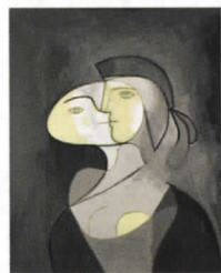
毕加索《玛丽-泰雷兹，正面与侧写》，布面油画和炭笔，111×81 cm，1931年。私人收藏，© 2012 Estate of Pablo Picasso/ARS, New York, 摄影/ Béatrice Hatala

利，询问他是不是艺术商彼得·百隆（Peter Blum）。在得到否定回答之后，对方却仍然不放弃：“你叫什么名字？我无意间听到你们关于纽约画廊的谈话……”接着他递过一张小纸片：“可以给你我的名片吗？”芬利客客气气地接过名片，并向对方道谢。我便成了年轻人的下一个目标：“你是谁？”他一本正经地问我，我被逗乐了，告诉他我是一名自由撰稿人。当然，我还是收下了名片，并向他表示感谢。名片的设计和印刷都非常专业，上面列出了有关作品的详细资料和联系方式。这是一位踌躇满志、有备而来的年轻艺术家！ 走出咖啡厅时，我忍不住笑起来。“现在的艺术家真是非常‘职业’呢。” 芬利也感叹：“简直富有生意头脑！” “是的，他们都是生意人。只不过如此一来，究竟谁在搞艺术创作？”芬利问道，随即又给出了答案，“或许是他们的助手吧。”