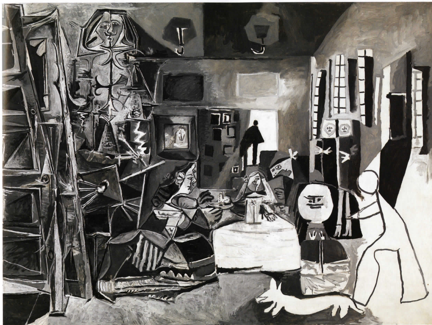
毕加索《宫娥，继委拉斯开兹之后》，布面油画，194×260cm，1957年。巴塞罗那毕加索美术馆收藏，艺术家捐赠，1968年，©2012 Estate of Pablo Picasso/ARS, New York, 摄影/Gassull Fotografia

“黑白毕加索”开展期间（12月24日及12月31日除外），每逢周日及周一，开放时间延长至20:00。