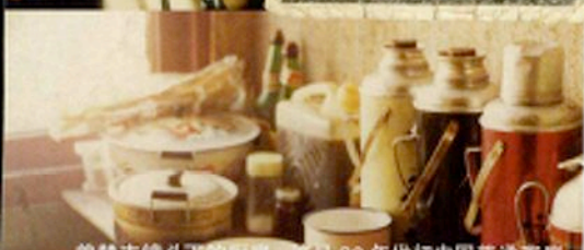
曾梵志镜头下的厨房，这是80年代初中国普通家庭的生活，那时曾梵志总是希望，厨房里要摆满食物。