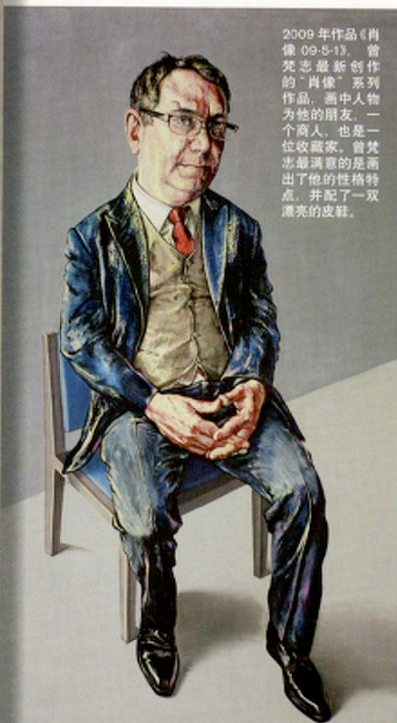
2009年作品《肖像 09-5-13》。曾梵志最新创作的“肖像”系列作品，画中人物为他的朋友，一个商人，也是一位收藏家。曾梵志最满意的是画出了他的性格特点，并配了一双漂亮的皮鞋。