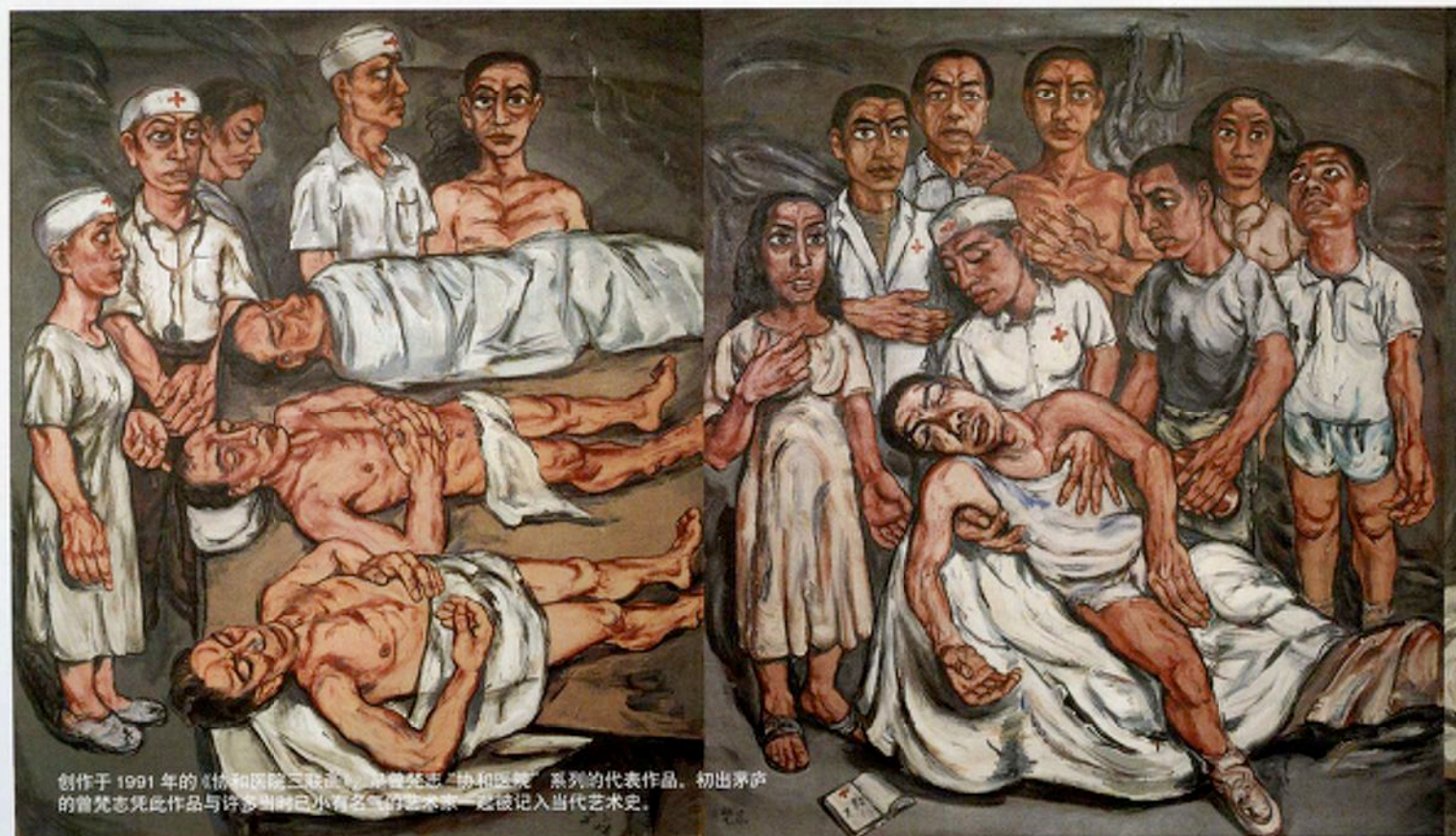
创作于1991年的《协和医院三联画》，是曾梵志“协和医院”系列的代表作品。初出茅庐的曾梵志凭此作品与许多当时小有名气的艺术家一起被记入当代艺术史。