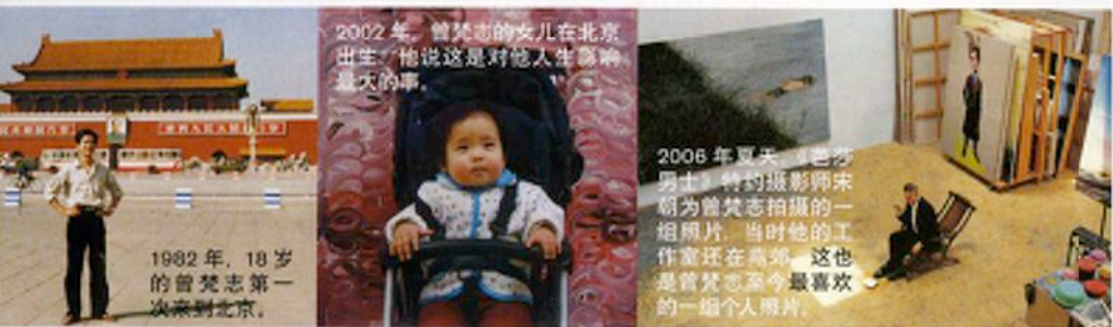
2002年，曾梵志的女儿在北京出生，他说这是对他人生影响最大的一件事。

但作为国家美术馆馆长，我愿意以更大概念来看中国当代艺术，这里没有老中青之别，只有多种语言多种材质的艺术家和他们的作品，并反映出我们这个时代的气象，曾梵志的作品多次出现在中国美术馆的展览中，也是一个很好的说明。▶