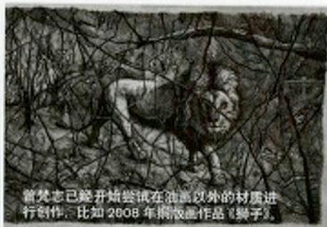
曾梵志已经开始尝试在油画以外的材质进行创作, 比如 2008 年铜板画作品《狮子》。