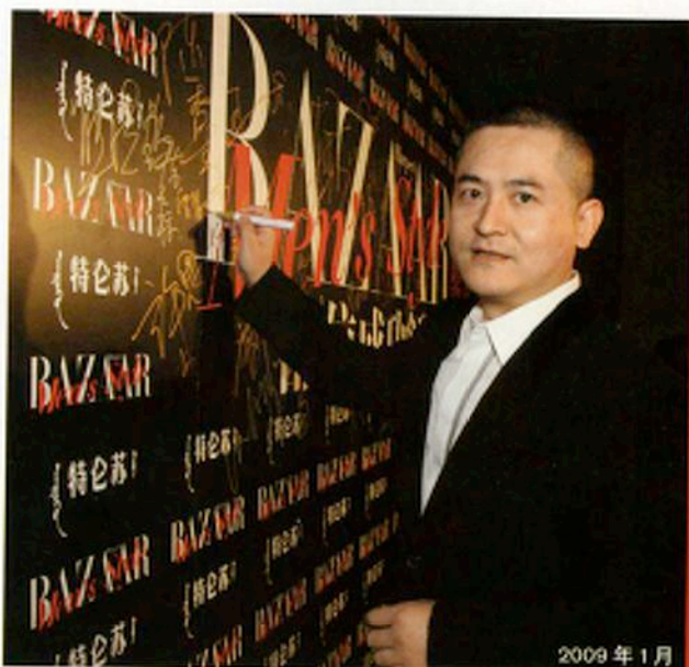
2009 年 1 月