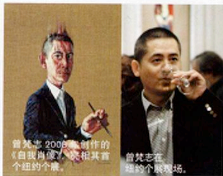
曾梵志2006年创作的 《自我肖像》,亮相其首 个纽约个展。

一个艺术家创作了好的作品,他就会在 艺术界存活,存活是非常重要的,我曾经问 过曾梵志类似的问题,他说自己没有想过 会卖掉作品,其实这是一种非常健康的方式。 一个艺术家在未来五年或十年里如何存活 下来?他可能要不断地创作作品,做别人 没有做过的事情,这种努力和尝试就会得 到回报。▶