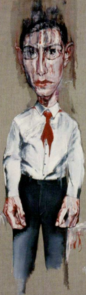
2001年作品《无题 No.113》，“面具”之后的代表作品，与以前作品的画法完全不同。