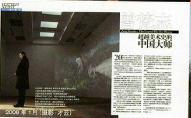
2008 年 1 月