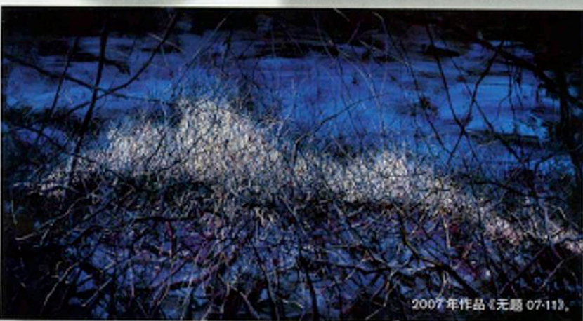
2007 年作品《无题 07-11》。