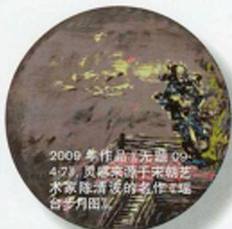
2009 年作品《无题 09-4-2》, 灵感来源于宋朝艺术家陈清波的名作《瑶台步月图》。