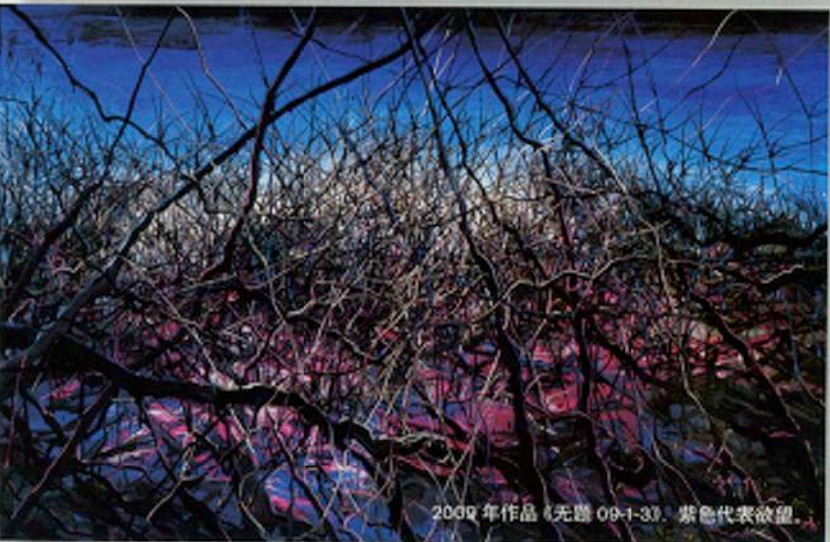
2009 年作品《无题 09-1-31》, 紫色代表欲望。