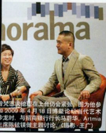
曾梵志在台上发言，周围有观众。2009年4月18日，曾梵志在苏州博物馆个展开幕式上发言。

美国人这才想到了之前与曾梵志的聊天。他们问曾梵志是如何推销自己的。曾回答，“我并没有推销自己”。这让美国人意识到，曾梵志非常聪明，而且与他同时代的艺术家都不同，很多画家都有自己的朋友，也和其他的画家组成一个交往的圈子，但是他们并不希望被并排