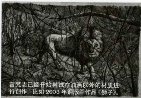
曾梵志已经开始尝试在油画以外的材质进行创作, 比如 2008 年铜版画作品《狮子》。