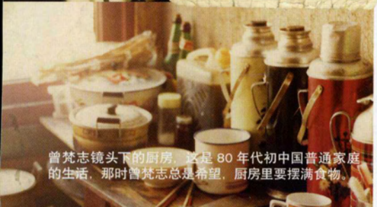
曾梵志镜头下的厨房，这是80年代初中国普通家庭的生活，那时曾梵志总是希望，厨房里要摆满食物。