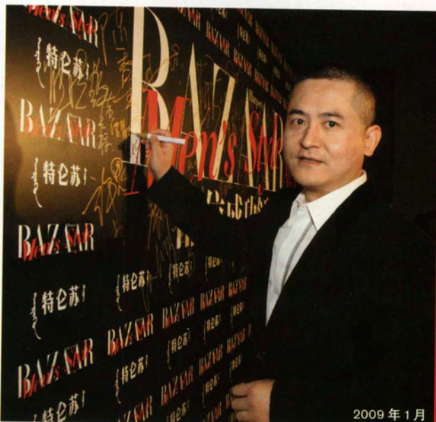
2009 年 1 月