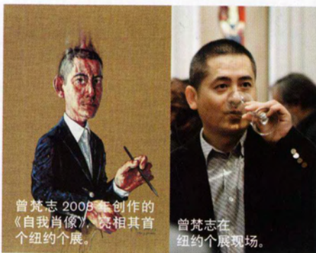
曾梵志 2005 年创作的《自我肖像》，亮相其首个纽约个展。

至于曾梵志会不会成为中国首位世界级的当代艺术家，我的观点是，并不是每一代每一个地方都会有世界级的艺术家。20 世纪下半叶，美国油画界有很多戏剧性的、激进的事件，还有第二次世界大战对西方世界的影响，产生了许多新的思想和油画作品，而此后，西方国家几乎没发生过什么大的事件。但是 60 年代，中