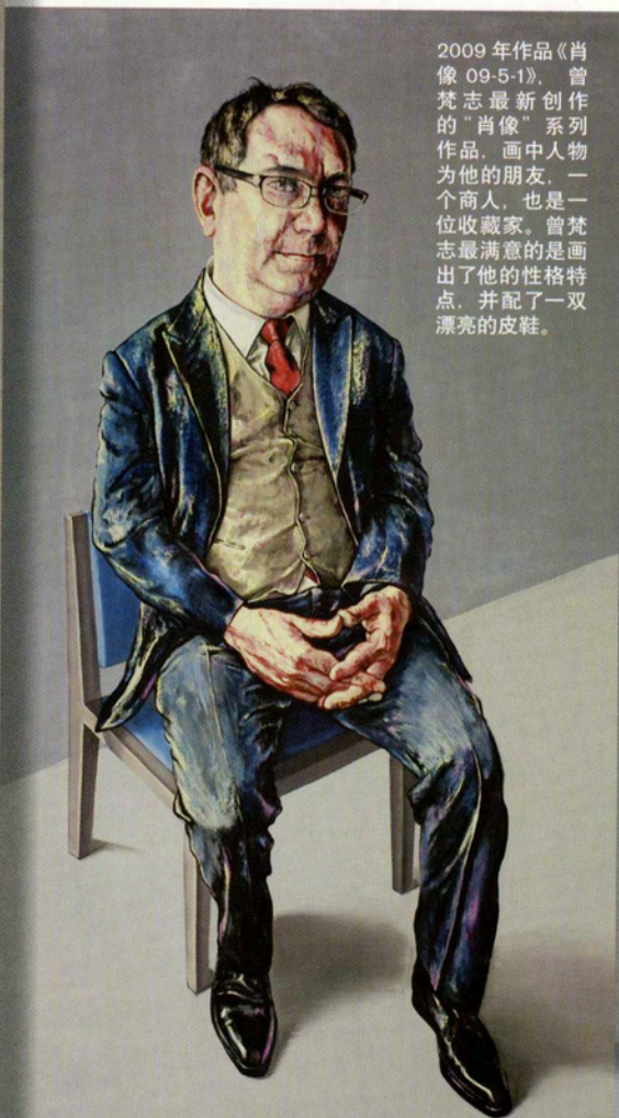
2009年作品《肖像 09-5-1》，曾梵志最新创作的“肖像”系列作品，画中人物为他的朋友，一个商人，也是一位收藏家。曾梵志最满意的是画出了他的性格特点，并配了一双漂亮的皮鞋。