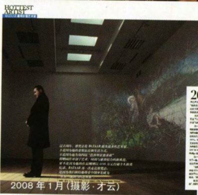
2008 年 1 月