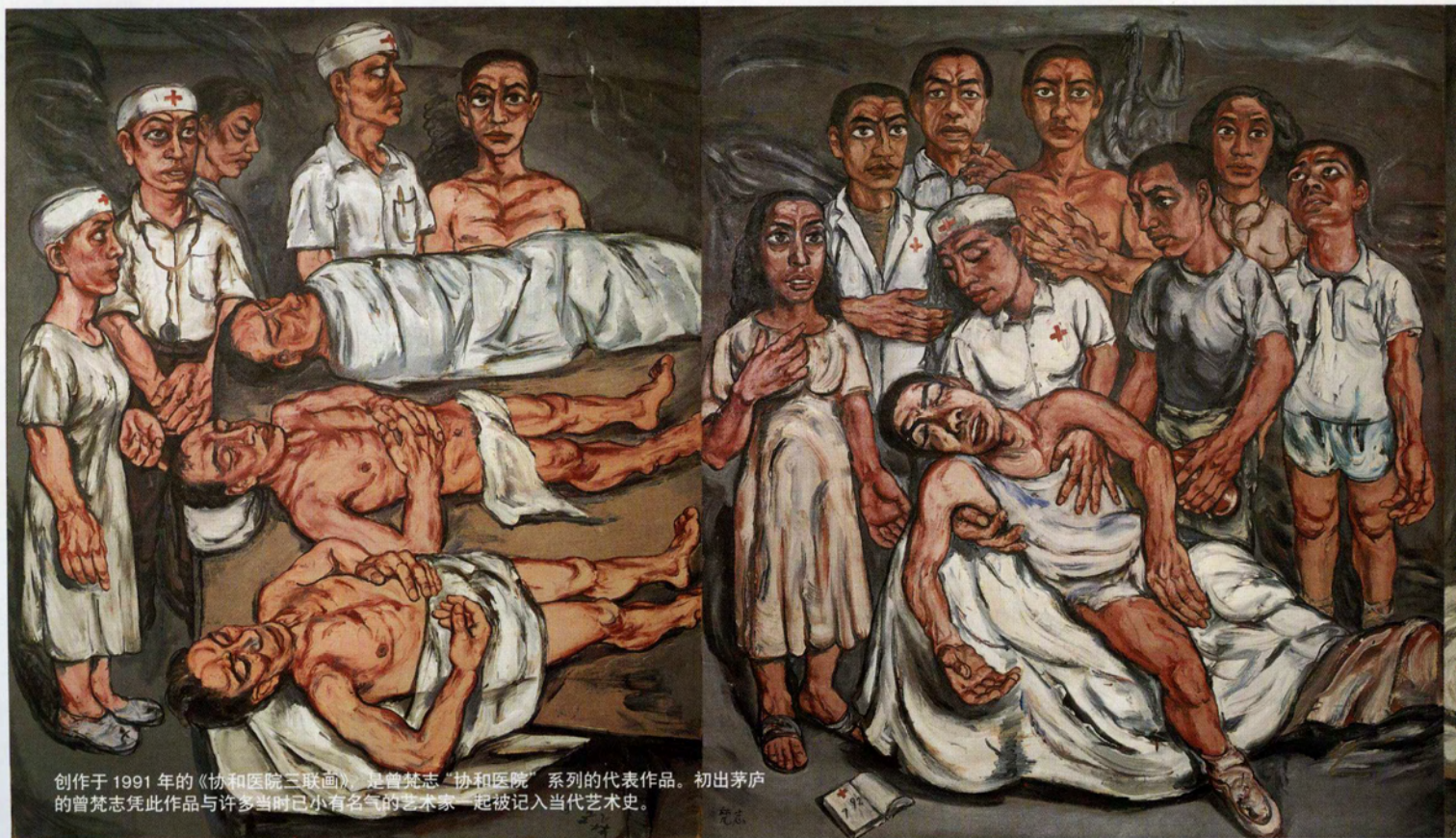
创作于1991年的《协和医院三联画》，是曾梵志“协和医院”系列的代表作品。初出茅庐的曾梵志凭此作品与许多当时已小有名气的艺术家一起被记入当代艺术史。