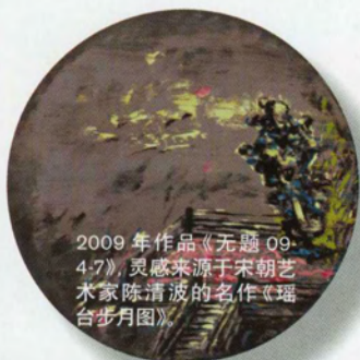
2009年作品《无题 09-4-7》, 灵感来源于宋朝艺术家陈清波的名作《瑶台步月图》。