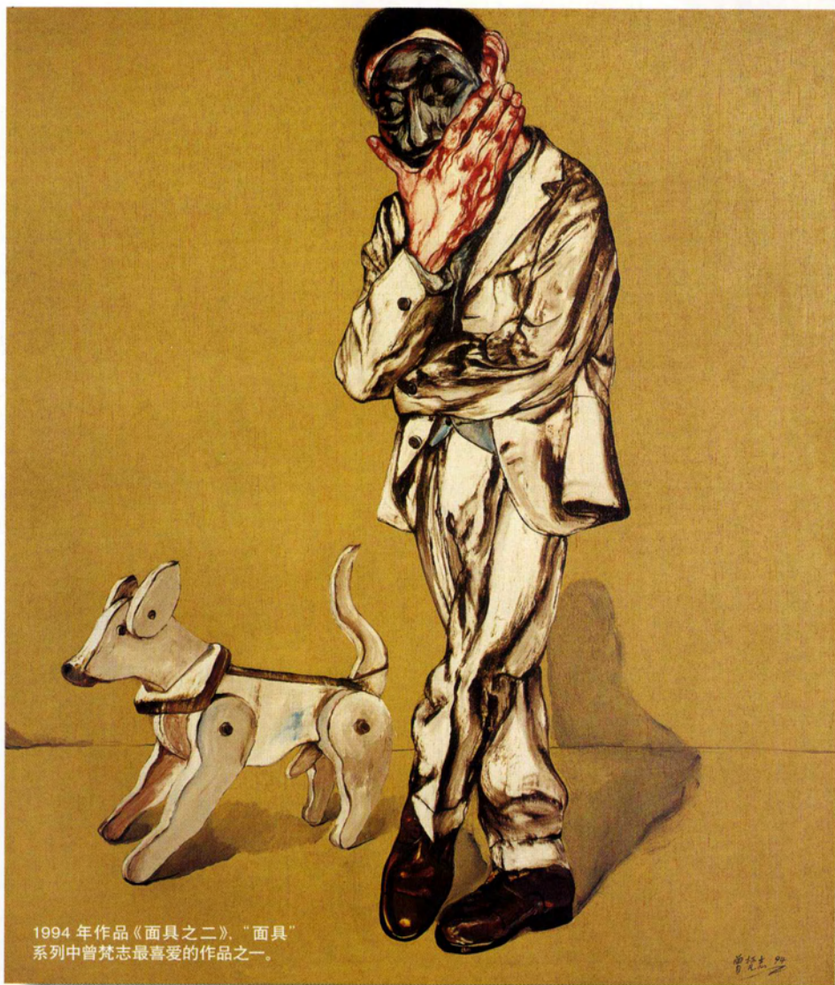
1994年作品《面具之二》，“面具”系列中曾梵志最喜爱的作品之一。

的洗手间，任何时候都有病人出入。被这种景象刺激，他创作了“协和医院三联画”。那年夏天，栗宪庭在武汉的小阁楼看到曾梵志的作品，其中“协和医院”系列让他十分惊喜，立即就把曾梵志纳入当时他正在筹备的后“89艺术大展”之内。这个展览聚集了54位艺术家的200余件作品，先后在中国香港、澳洲、美国巡回展出多年，成为中国当代艺术群体性走向国际艺术领域至关重要的一环。初出茅庐的曾梵志借此展览，与当时许多小有名气的艺术家一起被记入当代艺术史。