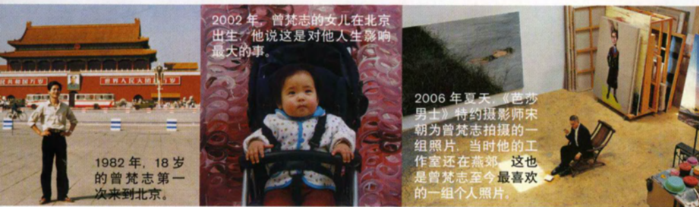
2002年，曾梵志的女儿在北京出生，他说这是对他人生影响最大的事。

但作为国家美术馆馆长，我愿意以更大概念来看中国当代艺术，这里没有老中青之别，只有多种语言多种材质的艺术家和他们的作品，并反映出我们这个时代的气象，曾梵志的作品多次出现在中国美术馆的展览中，也是一个很好的说明。▶