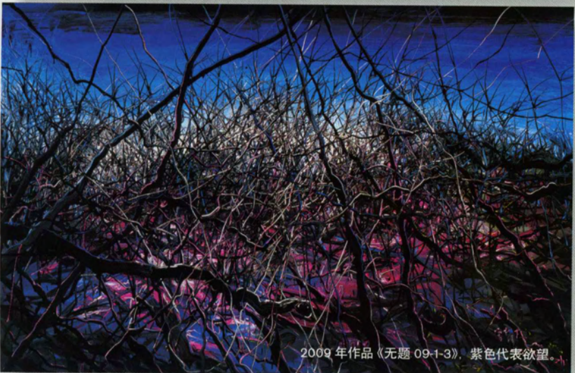
2009年作品《无题 09-1-3》, 紫色代表欲望。