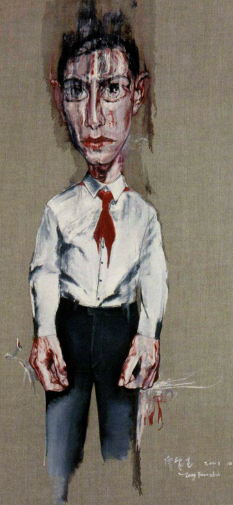
2001年作品《无题 No.11》，“面具”之后的代表作品，与以前作品的画法完全不同。